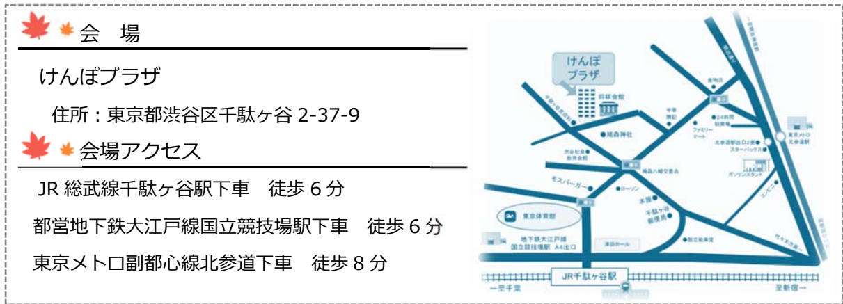
図—1 けんぼ プラザ 位置図