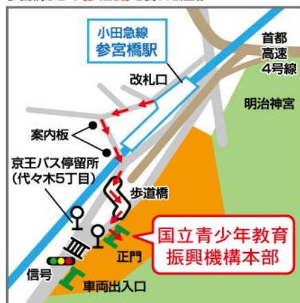
参宮橋からの【横断歩道】を使った経路