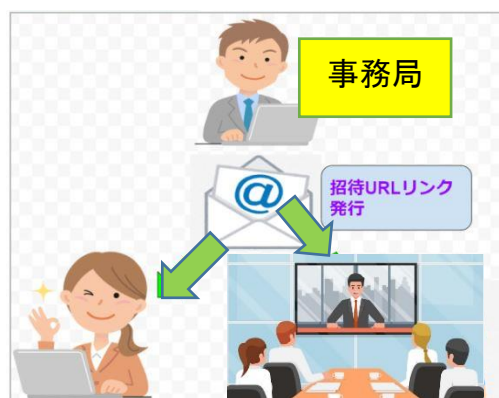
オンライン講習会イメージ

◆聴講者全員の「参加登録・参加費入金・アンケート回答」を以って「CPD」を発行します。