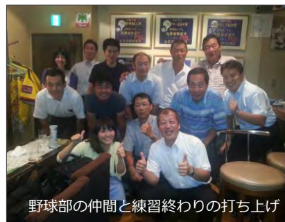
野球部の仲間と練習終わりの打ち上げ