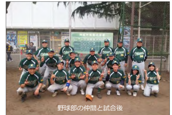
野球部の仲間と試合後

今では、野球部所属の先輩方と一緒に仕事をすることも増えました。また、協会が主催する野球大会で他社の方とも関わる機会が増え、野球部の活動が新たなコミュニケーションの場となっています。